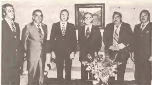
Tambe a worde bishita e pais Centro Americano, Costa Rica, na unda e delegacion Arubano a hiba combersacion cu e presidente di e tempo ey, señor Daniel Oduber.